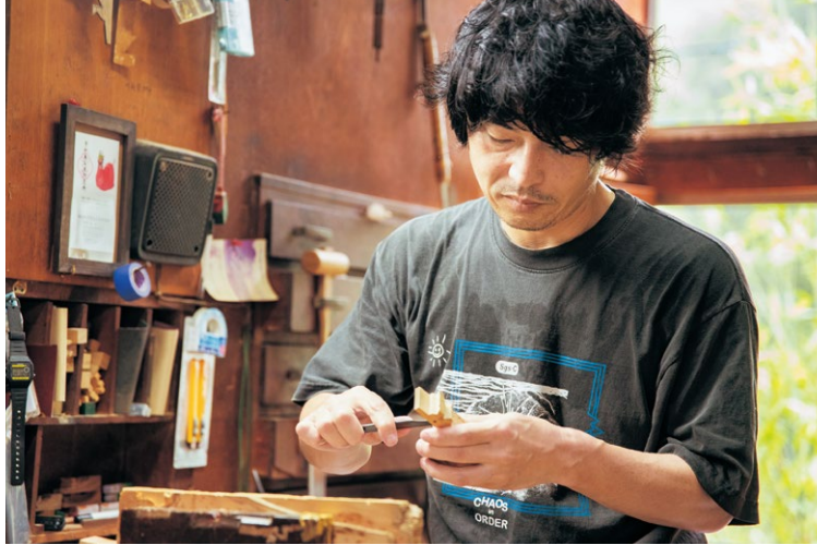
制作は父と弟と分業制。一さんは仕上げの彫り担当

書きをし、切り出します。その後、大まかに荒彫りをしたものに細かい仕上げをしていくのが一さんの担当。「まだまだ受け継いで3年。叔父や叔母の緻密な彫りの技には追いつけていません」と笑いながら答えてくれました。口部分は小さく内に彫り込む。体部分にも細かく面取りが行われるなど、謙遜とは裏腹に、繊細な手技の数々には見とれてしまいます。最後に、耳と剣の尻尾をはめ込み、赤と緑の染料で着色して、目を描けば完成。一体一体が手作りのため、表情が違うのも魅力の一つです。