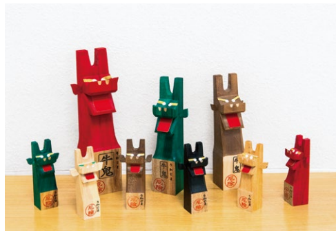
立ち牛鬼は色によって意味合いが異なるそう

「うわじま牛鬼まつり」は毎年7月22日から24日の3日間に開催。全長5メートルを超える色とりどりの牛鬼が街を練り歩き、街の邪気を払っていきます。祭りは市内の地域単位でも行われます。牛鬼が家々を巡り、玄関から長い首を覗き込ませて、家の中の厄を祓います。その様子に思わず泣いてしまう子どももいるのだとか。