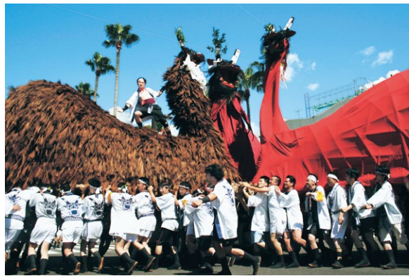
うわじま牛鬼まつりでは巨大な牛鬼が練り合う迫力のシーンが見どころ

宇和島市内を歩けば、お店などで多種多様の牛鬼ブーヤレと出会うことができます。黄色や青色のカラフルなもの、装飾されたものなど、実にさまざま。その多くは絵付け体験で作られたものだそう。コロナ禍に「うわじま牛鬼まつり」が中止