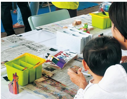
絵付け体験ではさまざまな牛鬼ブーヤレが彩られる

宇和島の人々を守る存在として愛された牛鬼を、未来につないでいく牛鬼ブーヤレ。今日も人の温もりから生まれた牛鬼ブーヤレたちが、この地に住む人々を見守ってくれていることでしょう。