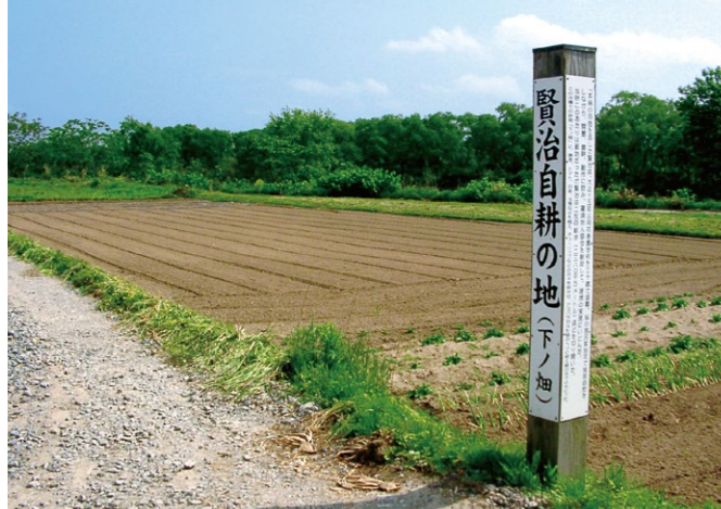
花巻市内には宮沢賢治ゆかりの地が多く残る