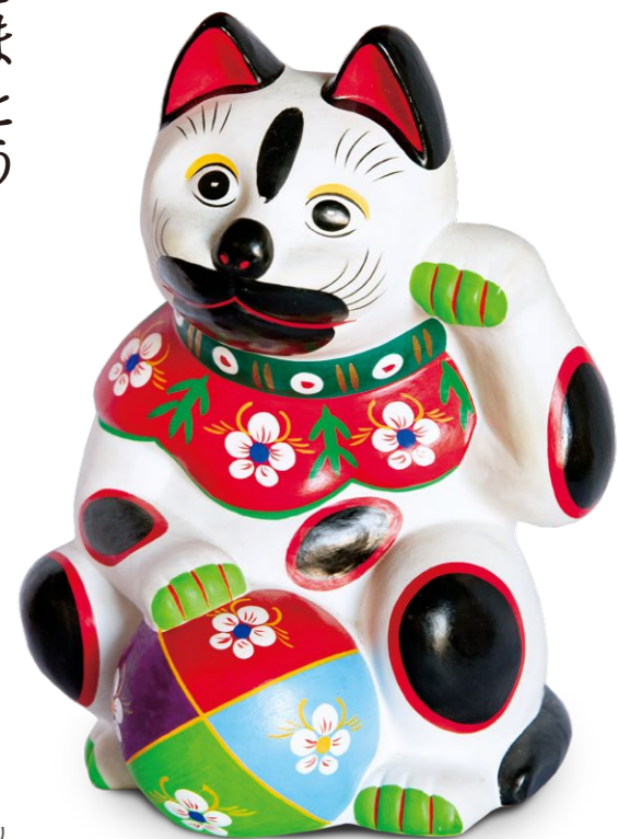
同じ型でも色違いがあり、約200種類ほどが現在も作られる

また、同博物館では所蔵しているコレクションの一部を展示するテーマ展も定期的に開催しています。「その昔、ひな人形はとても高価で、たやすく買える物ではありませんでした。そこで土で作られた安価な花巻人形をひな壇に飾ってお祝いした