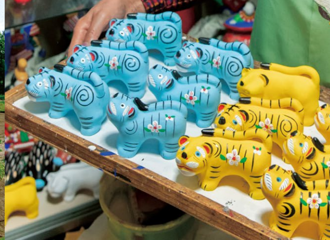
2022年の干支人形。「毎年楽しみに集めている方もいるんですよ」とのこと