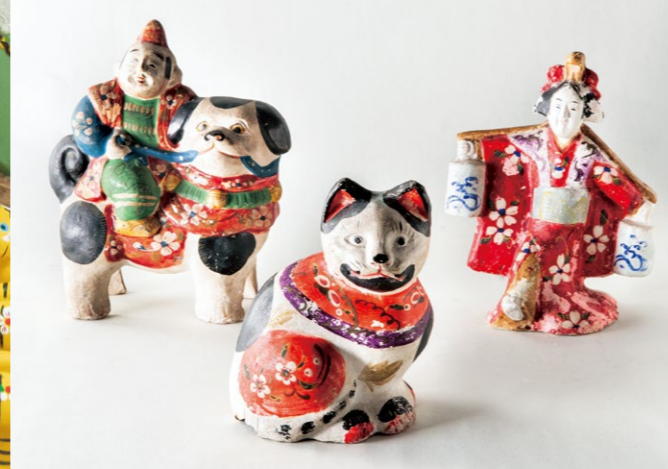
花巻市博物館には570種類3500点以上が保管されている