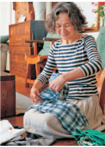
洗濯物を畳むのも朝の日課なのだとか

よく驚かれるのですが、私は夜に洗濯物を干しておいて、朝、取り入れて畳んで片付けるのです。その後、7時頃に夫（今はリタイアしています）や孫と朝食をとって孫は学校、夫は畑へと送り出し、私は簡単なお掃除と晩ご飯の下ごしらえをスタート。全てが終わるのはだいたい9時くらいで、それから孫が学校から戻る15時過ぎまでが自分の時間です。