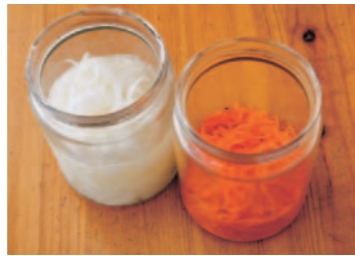
にんじんとたまねぎは酢漬けにして保存。料理にも使えるし、食卓に彩りを加えたい時はサラダとして添えることも