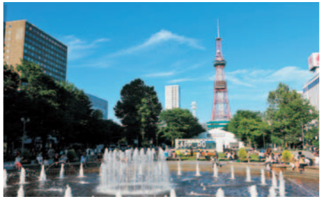
さっぽろ雪まつりが開かれることで有名な大通公園。周辺にはドリ大の名前の由来ともなった賑やかな街が広がっている

人口約190万人、北の大都市札幌。ここに、校舎も試験もない一風変わった大学があります。札幌オオドリ大学(通称・ドリ大)は、いわゆる学校としての大学ではなく、街全体をキャンパスと捉え、市民が学び合う取り組みです。「大通り」が街の象徴であることからその名がつけました。学ぶのは札幌の街に溢れているさまざまな文化。意見を交わしながら学ぶのがドリ大流です。