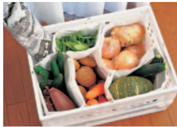
急に足りなくなって焦らないよう、定番のお野菜は常にストック

最後に、時間を上手に使うコツとしておすすめの方法を。何に何分かかるか、時間を測ってみてください。例えば、家族分のお茶碗を洗うのに何分かかかるかなど。それを把握しておく、何時までに何ができるか大まかな予定を立てることができて、お出かけ前などに焦らなくて済みます。やってみると5分、10分でできることが意外と多くて驚かれます。お試しください。試してみてください。