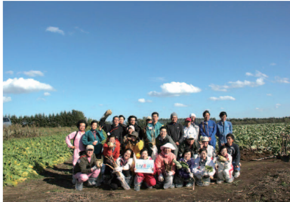
ドリ農部秋の行事「食欲の秋に上士幌町を満喫。掘って掘って掘りまくれ!!」では、通常機械で収穫するごぼうとビートを手作業で掘り起こすのだそう