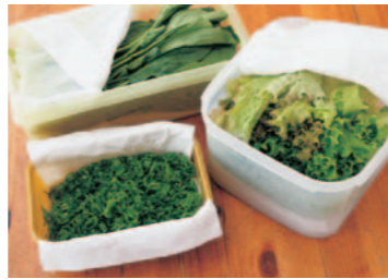
葉もの野菜は洗って、ねぎは小口切りにして冷蔵庫に保存しておく、料理をする時の手間が省けて便利なのだとか