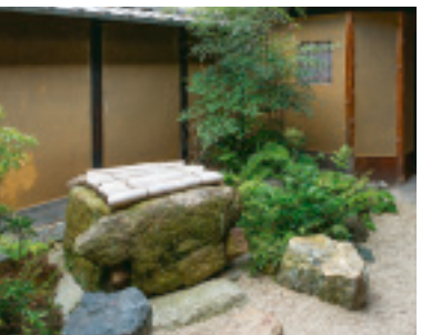
町家の井戸。両脇に必ずある石は？「行灯と桶を置くため」なんです！

京都は戦災をまぬかれ、寺社仏閣と伝統の町家が美しい景観を残す、世界に冠たる古都。古風な造りの町家を愛して、移り住んだり、外国の方が借りたりすることも多いそうです。