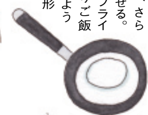
裏向きで皿を置く