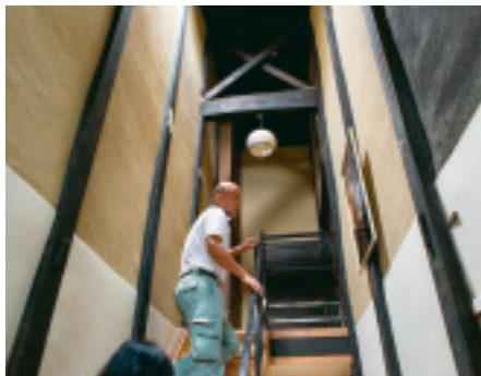
新しい階段の下は土間に床を貼った台所。階段上のXの形は後付けの耐震対策。