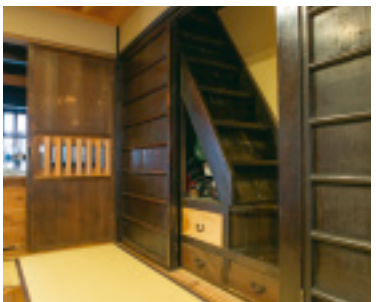
「昔の階段はこんなに急。一人しか通れない狭さで段も高く危険です」