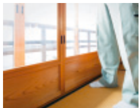
大正元年築だから引き手は下。「和服で膝ついて、ですわ」