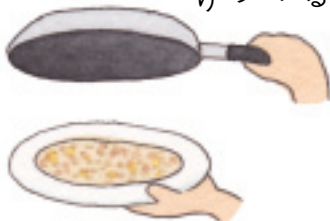
ひっくり返すときは やけどをしないように

◎作り方(大きめのフライパンで8切れ分) 白いりごま大さじ3は、すり鉢で粗めにする。青ジソ6枚は細切りにしておく。冷やご飯300gをボウルに入れ、カッテージチーズ100g、すった白ゴマ、かつおぶし3g、しょう油大さじ2と酒大さじ1の合わせ調味料、青ジソ、ごま油大さじ1の順に入れて、その度に混ぜ合わせる。具材が全体に行き渡るまでしっかりと混ぜる。仕上げに小麦粉大さじ1を振りかけ、さらによく混ぜ合わせる。テフロン加工のフライパンに具材入りご飯を入れ、ピザのように薄くのばして形を整える。弱火でじっくりキツネ色になるまで焼き上げる。途中、フライパンをゆすりながら、焦げつかないように焼く。片面8〜10分くらいが目安。