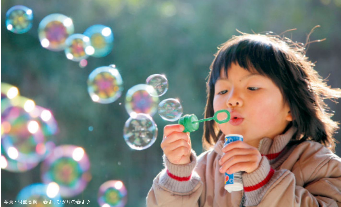
春よ、ひかりの春よ