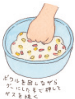
ボウルを回しながら、かき混ぜてスープを絡めよう

生地が膨らんだら、フタを取って弱火にかけ、片面を約20分焼く。途中10分ほどフライパンを少しゆすって、生地を動かす。生地が乾いてきたら、裏返しにして、さらに15〜20分弱火のまま焼き上げれば出来上がり。