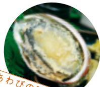
◎あわびの味噌漬け