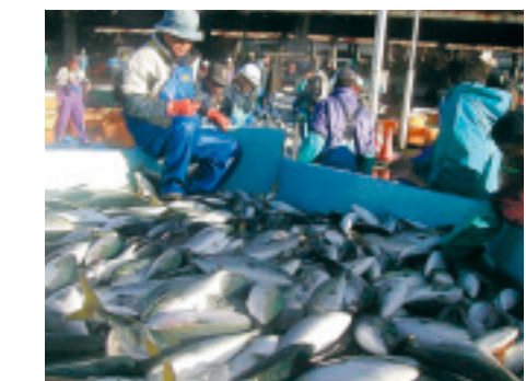
魚市場での水揚げ風景。