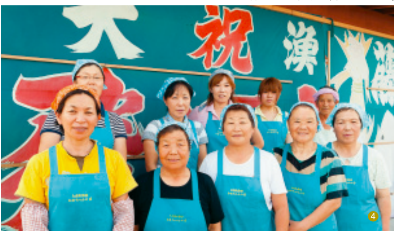
その日あがった旬の魚が食べられるよ〜

「大洗は一番いいとこだ。釣りもできるし」機嫌良く酔って いた男性も、すぐ姿が消えた。ここはやっぱり「かあちゃん の店」なのだった。