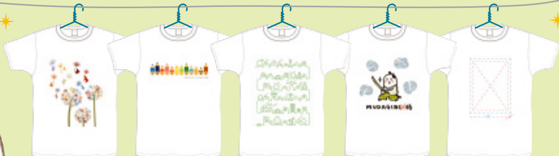
身近に、未来に、エコのタネまき。 くりがえし使うエコ みんなで使うエコ 減らすエコ 捨てないエコ

ダスキンと雑誌『Pen』の協力企画、 「エコTシャツデザイン大賞」のグランプリが決定しました。 エコにまつわる5テーマにあわせて応募いただいた作品は、なんと 2000点以上。みなさんの投票で選ばれたグランプリ作品のTシャツは、 ダスキンが出展するイベントなどで着用されています。 詳細は“ダスキンエコT”で検索してください。