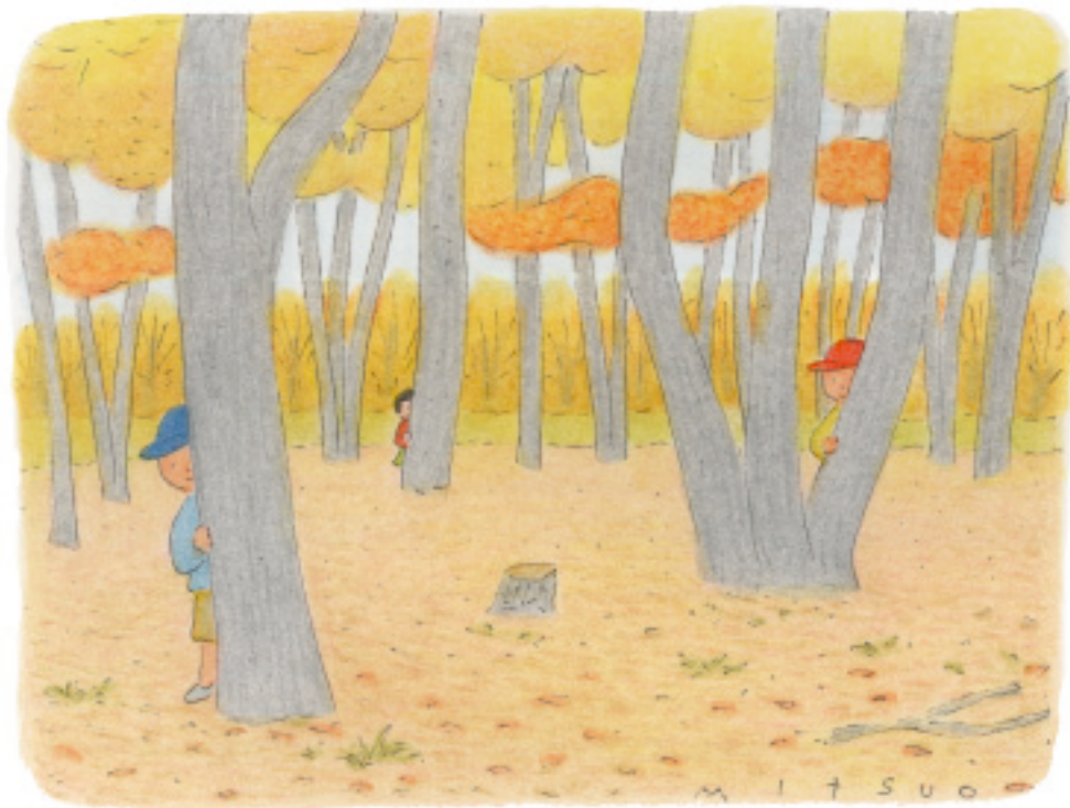
絵と文 中村みつを

イラストレーター、画家。旅・人がテーマで、心の和む温かさ。読売新聞夕刊のみなみらんぼうのエッセイ「一歩二歩山歩」に挿絵を描き、新聞連載最多記録14年目。日本山岳会会員。著書に「のんびり山に帰るはのぼる」(山と溪谷社)、「お江戸超低山さんぽ」(書肆侃侃房)、「森のくらし」(リヨン社)など。