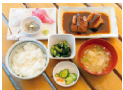
上はおちゃん御膳。かあちゃん御膳と共に1200円 はお値うち。冬は肝で煮込んだ浜鍋が美味!

2班が魚の下ごしらえ。わかるがわるで回すので、休憩時 間がない。みんな、ものすごい働き者だ!