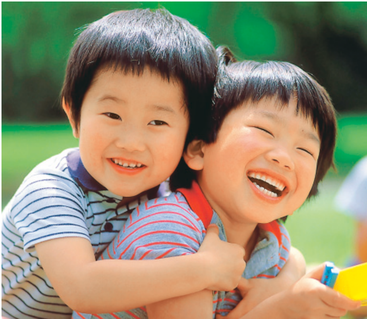
写真・市谷 健「あ、あっ、ダメダメ、ぎゃははは」