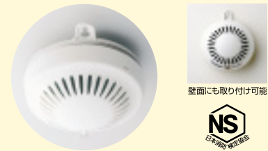
壁面にも取り付け可能