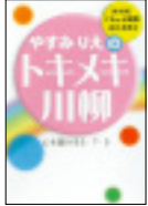
『やすみりえのトキメキ川柳 心を届ける5・7・5』 定価：1470円(税込) 出版社：浪速社 (B6版204ページ)