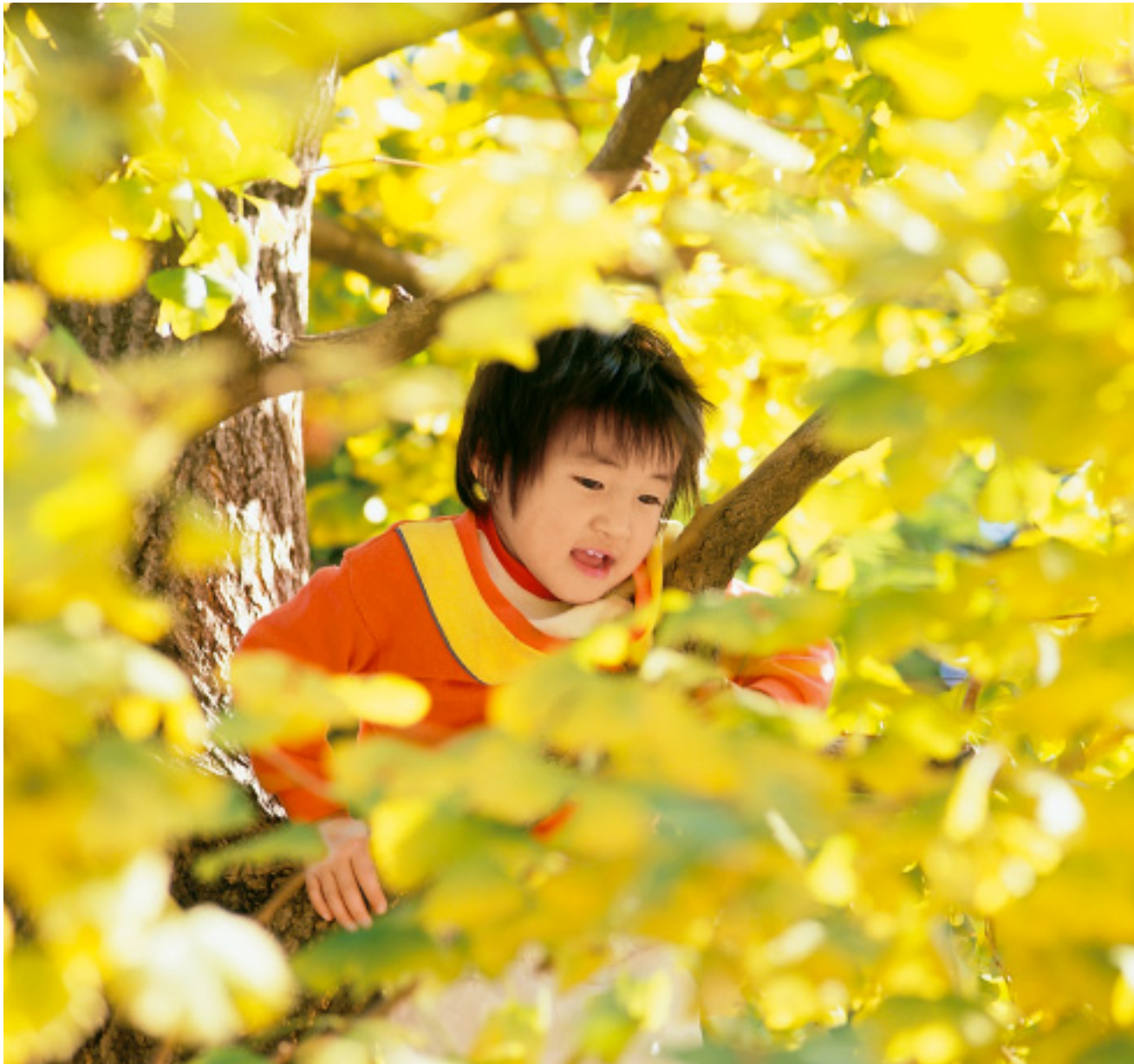
「世界はかがやいているんだよ、ね！」