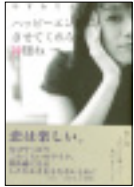
『Happy Endにさせてくれない神様ね』 定価：1260円(税込) 出版社：新葉館出版 (B6版90ページ)