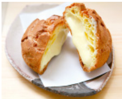
サクサク感のある皮が香ばしいシュークリーム。カスタードが光ってます。ぜんぶ自家製素材。

スイカと杏仁、塩とみかん、抹茶とミルク、黒豆も。旬の素材は日替わり。どれにしよう!