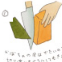
かぼちゃの皮をきれいにむき、1.5cm角くらいの厚さにカットする