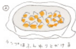
ラップをはふしホリとかける

30分おいたかぼちゃにラップをかけて、電子レンジで5分くらい加熱する。やわらかくなったところを裏ごしする。鍋に牛乳200mlとグラニュー糖大さじ1、バニラエッセンス少々を入れて火にかける。ヘラでゆつくり混ぜながら温