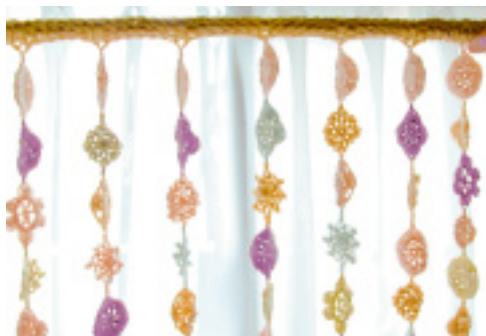
こんなに沢山の彩りを桜からもらえる!この紫色は種から毛糸のかぎ針編み。