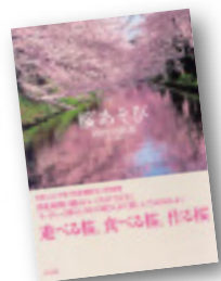
「桜あそび」 岡村比都美著 WAVE出版 1300円+税