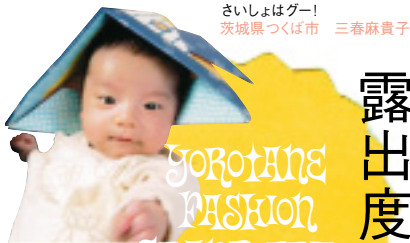
さいしょはグー! 茨城県つくば市 三春麻貴子