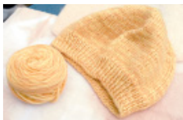
国立の寒桜と大寒桜から染めた思い出の色。この毛糸は多くの人の手に渡った。