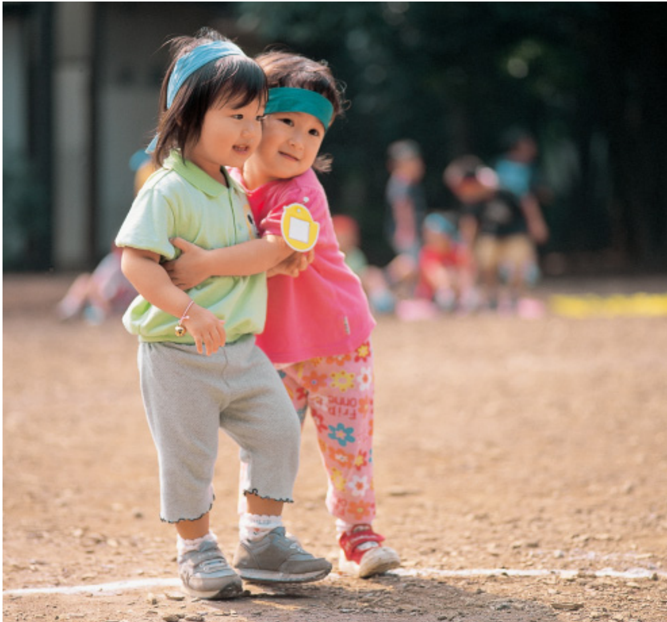
「やさしさに、つまれたなら」