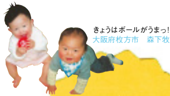
きょうはボールがうまっ! 大阪府枚方市 森下牧