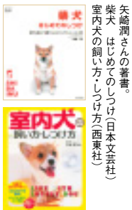
矢崎潤さんの著書。 柴犬はじめてのしつけ(日本語版) 室内犬のしつけ方(西東社)