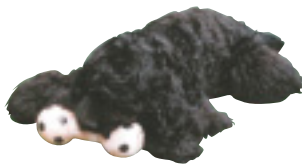
「モップ犬」と呼ばれているイザム 茨城県結城市 百目鬼東海江