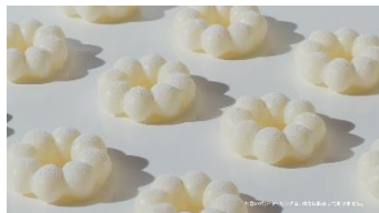
ミスタードーナツ♪