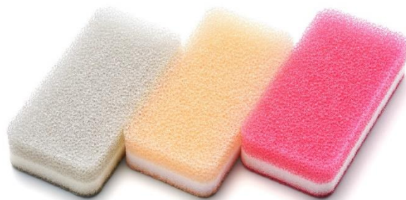
台所用スポンジ ソフトタイプ 3色セット

株式会社ダスキン(本社：大阪府吹田市、社長：山村輝治)が展開するクリーンサービス事業は、ロングセラー商品「台所用スポンジ」の新タイプ「ソフトタイプ」を、2022年7月11日(月)に全国で発売いたします。