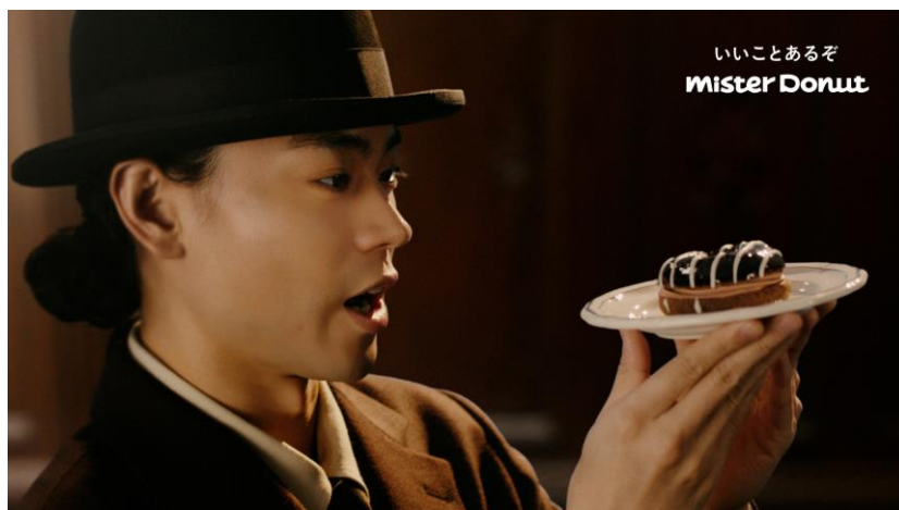
<新TVCM『ヴィタメール「もはやケーキ？」』篇より>

株式会社ダスキン（本社：大阪府吹田市、社長：山村 輝治）が運営するミスタードーナツは、2022年最初のmisdo meets新品『misdo meets WITTAMER ヴィタメールコレクション』の新TVCMとして、俳優の菅田将暉さんが出演するヴィタメールコレクション「もはやケーキ？」篇（15秒）を、2022年1月7日（金）から全国で放映開始します。