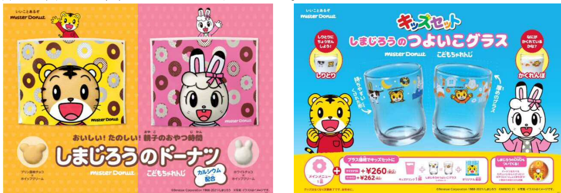
©Benesse Corporation 1988-2021/しまじろう ©MISDO 21