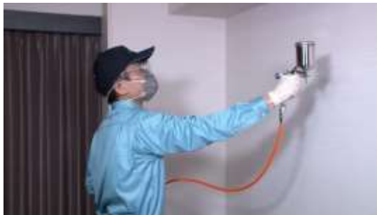
サービスシーンイメージ

株式会社ダスキン（本社：大阪府吹田市、社長：山村 輝治）が展開するサービスマスター事業およびメリーメイド事業では、衛生的な環境が求められる医療・介護・教育施設や飲食店などの事業所や衛生意識の高い一般家庭に向けて、室内の壁・天井などに抗菌・消臭等の効果がある光触媒を採用した抗菌加工サービス「室内抗菌加工サービス＜光触媒＞」の提供を、3月1日から全国で順次開始します。