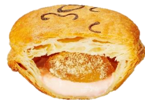
「もちもち桜わらび餅」 320円