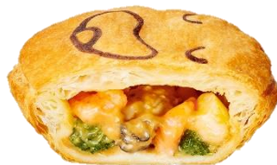
「牡蠣と小柱のエビクリーム」 390円