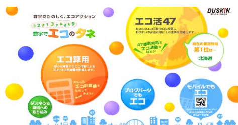
「数字でエコのタネ」トップページ

当サイトに参加いただいた方からの声で「小学生の娘も楽しくエコを学びました」「目に見えるエコ計算機でエコを身近に感じました」などが寄せられています。