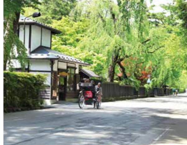
桜の名所としても知られる角館町の武家屋敷通り