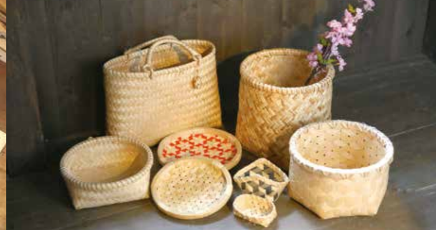
お盆や籠、手提げなど種類も豊富。イタヤカエデの白い木肌が美しく、丈夫で長く使えるのが魅力