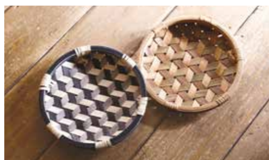
新品(左)と使い込まれたお盆(右)。藍色もきれいな飴色に

イタヤ細工づくりは、生木のうちに幹を割り、1ミリメートル以下の薄い板に削り出した後、帯状に裂きます。それを一本