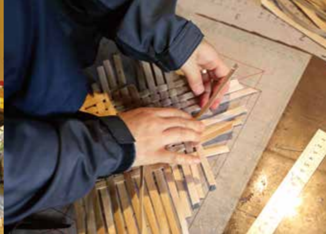
不揃いな帯を見極めながら、均一に編んでいくのは職人技