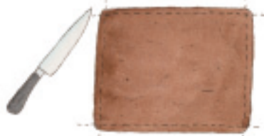
お好みの大きさに切るとは、少し柔らかい状態に焼く

180℃に予熱しておいたオーブンで30分くらい焼く。焼きあがり心配な場合は、中央を竹串で刺してみる。焼き上がりしたら、お好みの大きさに切って出来上がり。予熱で火が入りすぎると生地が硬くなるので、完成したらすぐにオーブンから出すこと。