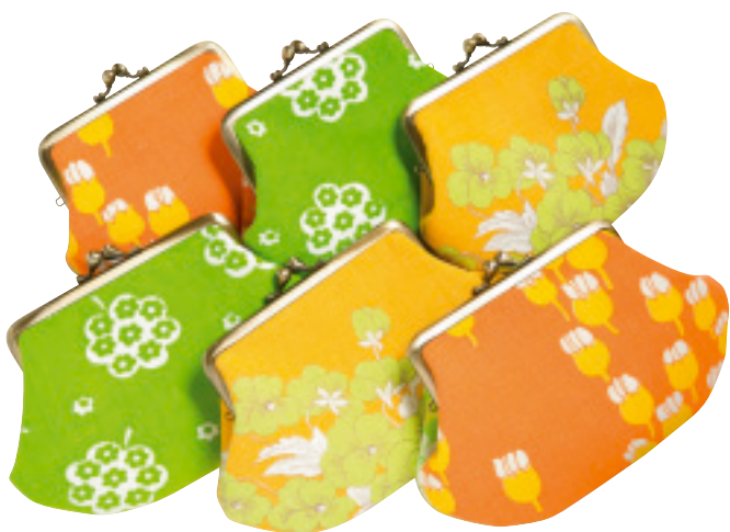
がまぐちって財布だけじゃない。化粧ポーチ？それとも何をいれようかな？