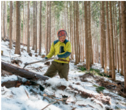
「背中が広いでしょ。乗って安心感がある馬なんです」自然はみんな再生していける。もちろん人力も馬力も。

それ以前は合戦の馬。馬格や馬力で生死が分かれたので、武者にとつて南部馬はいわばブランドだったという。とは言っても、「日本の馬は千年前から小型で、お侍が乗る馬はみんな小さかった」と岩間さん。