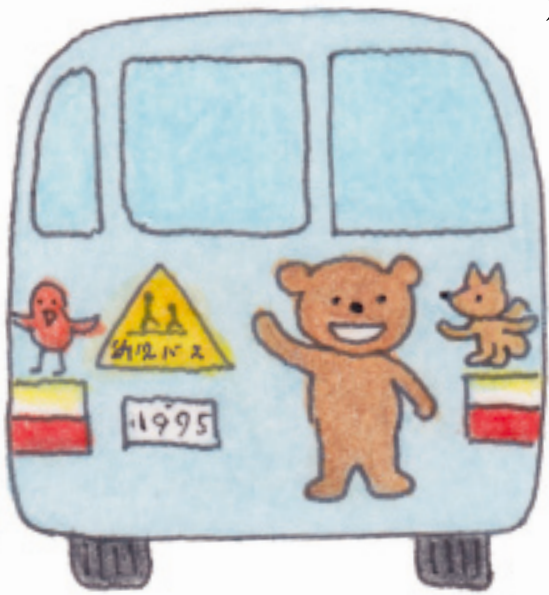
絵と文 中村みつを

友人は「バスに楽しい絵を描きましよう！」と、園長にでっかいことを言ったらしく、ぼくに何度も拜むように両手を合わせた。それがあまりにも真剣で「バスに絵を描くのも楽しいかも」。そう思った