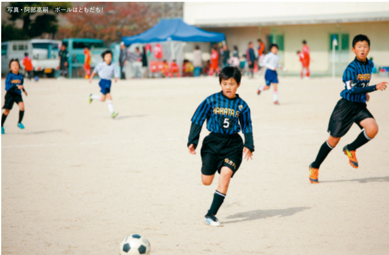
ボールはともだち!