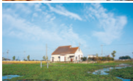
上は「羽島クレソンの里」でのお手伝い作業風景。畑いっぱいクレソン。気分は緑風献上だそうです。