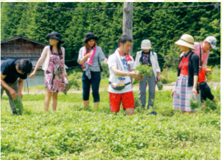
山の農園で種まきから収穫まで、豊かな交流は世代をこえて。

そうして、畑に清水が流れていない場所を見つけては、群生しすぎた株を分け、少しでも葉の色が悪いと、もういちずに作業する。