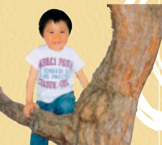
笑顔でポーズ。 群馬県安中市 中嶋八千江

家族や友だちにしか撮れないステキな笑 顔、みんなに見てもらいたいわたし好みの 1枚。もちろんかわいいペットも撮れたら 送ってください。お待ちしております！ (詳細は7ページ)