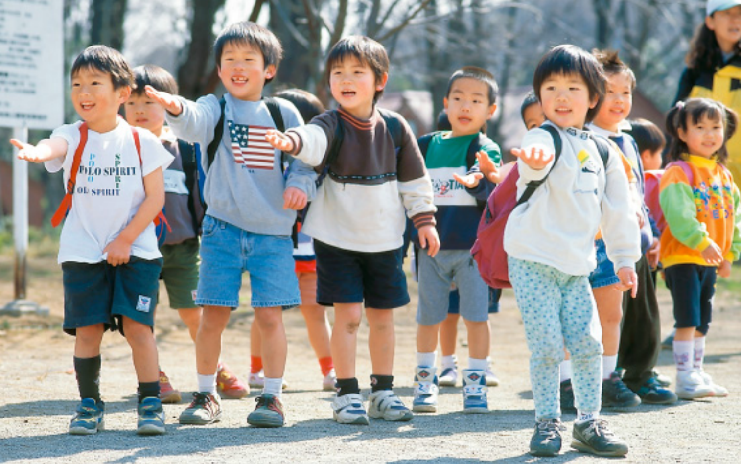
「さあ、さあ、もう一歩前へ！」