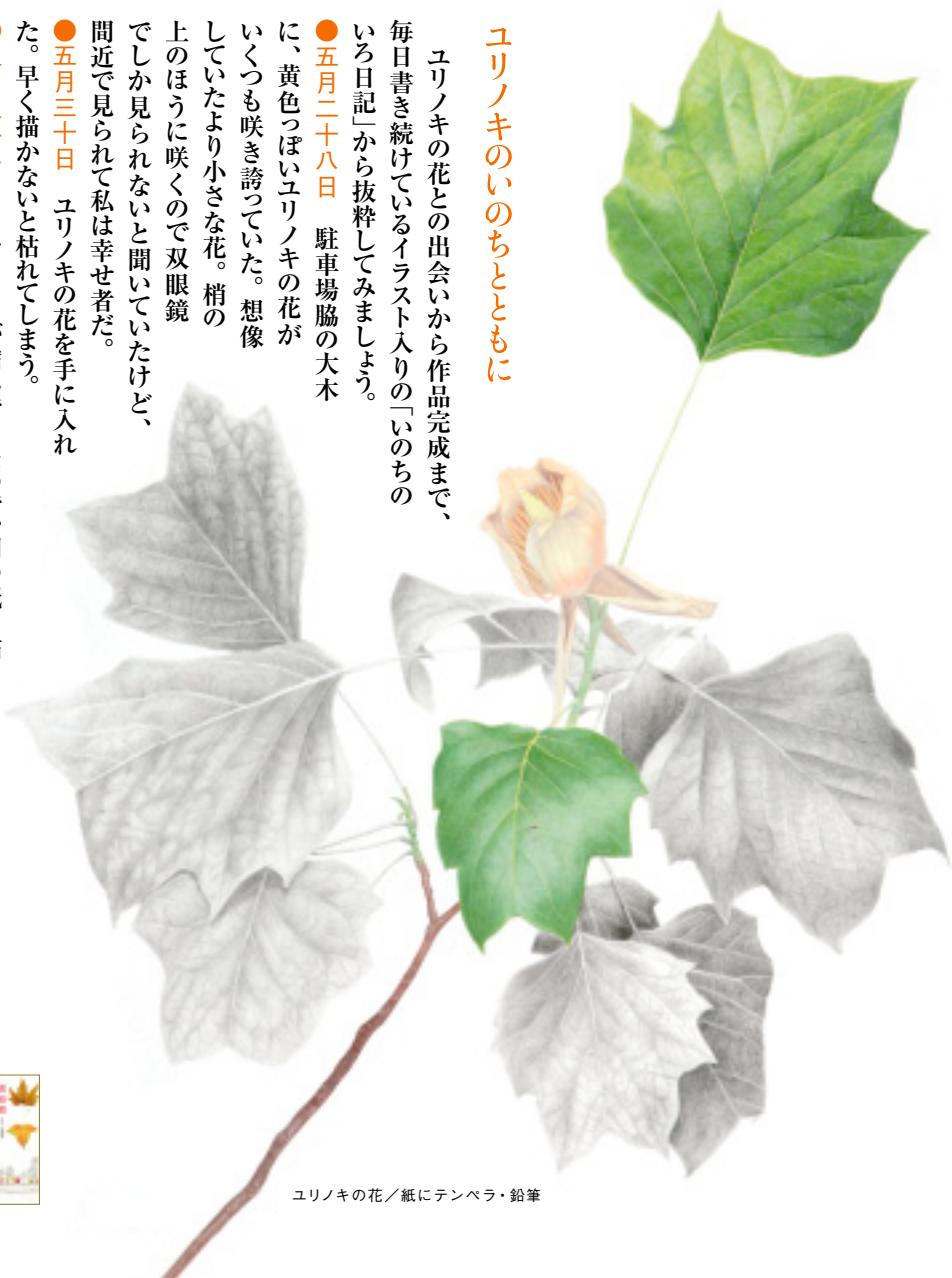
ユリノキの花／紙にテンペラ・鉛筆

●六月九日 カラーで描く予定の葉っぱが枯れた。朝一番で、葉っぱを採取しに行く。気のいい造園屋さんが、「どうぞどうぞ何枚でも〜」とにこにこ顔。心が温まる。早くも葉っぱが枯れそうなので、写真に撮って押し葉で保存。