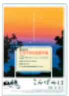
映画「こんばんは」 DVD・VHS 生活必要漢字は381文字 だという。学ぶことで 境遇や体験を乗り越え ていく力や希望の生徒 を見つけていく生徒の 姿が描かれる。