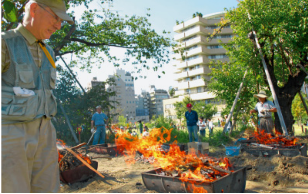
焼き芋用にタテ半分にしたドラム缶。 チップに出来ない木もついでに焼いて、 冷めたら灰を完全利用。