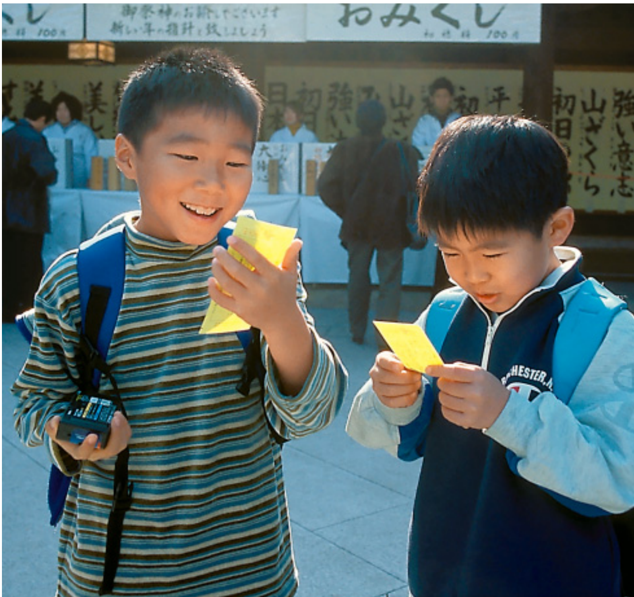
「これなら、もうひとつお願いしちゃおうかな」