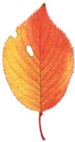
ソメイヨシノ (左)11月6日 (右)11月13日