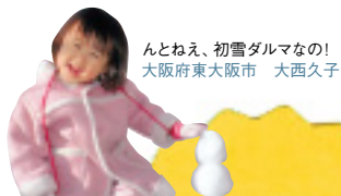
んとねえ、初雪ダルマなの! 大阪府東大阪市 大西久子