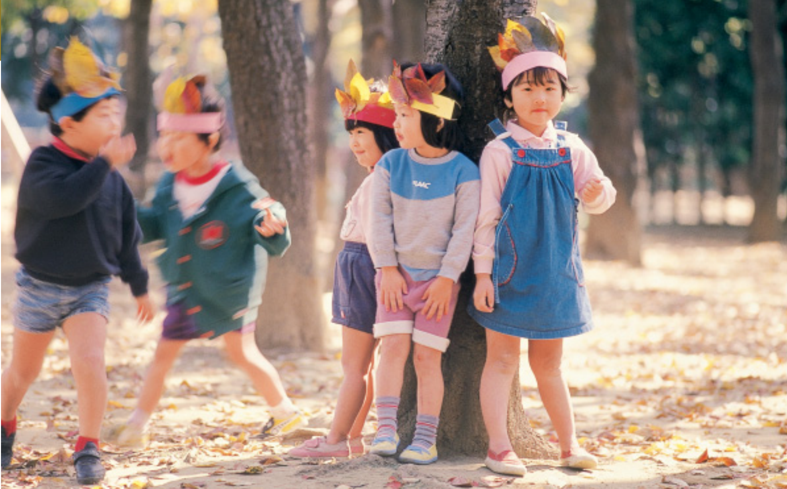
「今日ほみんなインプリアンさ」