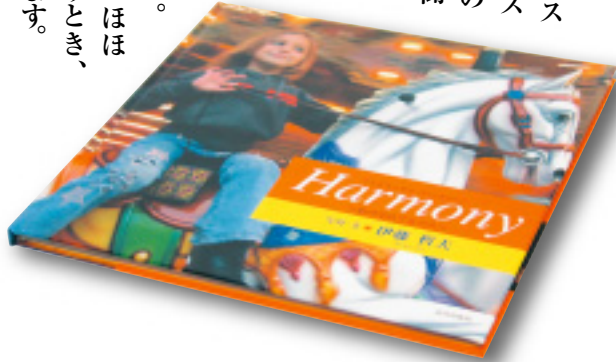
フォトエッセイ「ハーモニー」(近代出版社) 写真・文 伊藤哲夫

南仏旅行で出会った人々、そして日本では、昔からゆかりの人たちを撮りました。写真集の全てのひとが笑顔。ほほえみから大笑いまで…。笑うとき、ひとは心を開いていると思います。