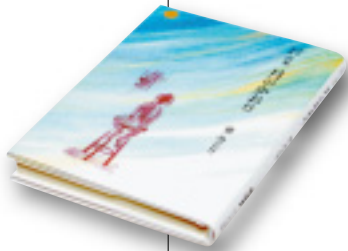
月のかおり(らくだ出版) 童みどり 著