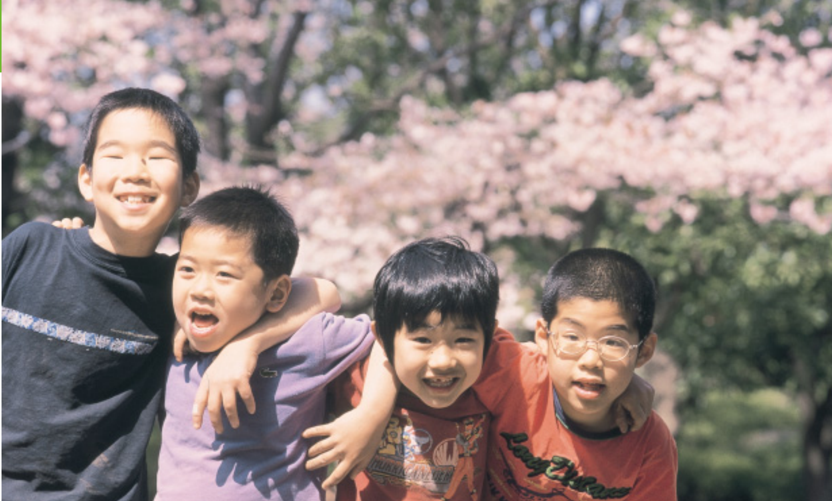
大事なものはそばにある