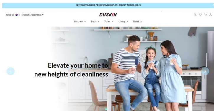
海外向け公式 EC サイト画面（イメージ）